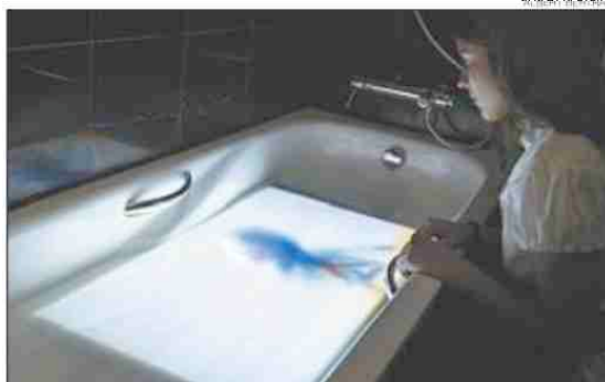
LAS JÓVENES PROMESAS Qué mejor lugar que la bañera de un hotel para ver los videos del irónico dúo de veinteañeras Momu & No Es.

Desde hace 14 años, la muestra Fem Art que organiza Ca la Dona pretende dar visibilidad al «lenguaje artístico distinto» del que habla Rocamora. Mientras el Loop ingresa 340.000 euros (de la Generalitat, el Ayuntamiento y el Ministerio de Cultura), Fem Art solo recibe 3.000